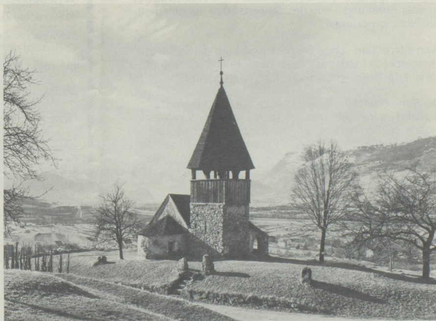
La chapelle de Triesenberg

trouvait à côté des nobles, les couvents de Saint-Gall et de Weingarten. De son côté la famille princière du Liechtenstein fit également des offres. Il est possible de suivre l'évolution de la noblesse du Liechtenstein dès le 12 e siècle, dont l'influence à la cour de Vienne trouva son apogée au cours des 16 e et 17 e siècles. Malgré la possession et l'acquisition de territoires étendus, elle ne put prétendre à une voix et à un siège de grand électeur auprès du Saint empire romain germanique, car l'ensemble des contrées sous sa juridiction étaient trop éparpillées. Afin d'y parvenir, Jean Adam André du Liechtenstein, prince, grand mécène de l'art baroque et régisseur de talent, regroupa pour son compte la seigneurie de Schellenberg en 1699 et le comté de Vaduz en 1712. L'empereur Charles VI assembla en 1719, les deux provinces, créant une principauté impériale portant le nom de Liechtenstein (343 e membre du Saint empire romain germanique). Il en résulta, à l'intérieur du pays une plus grande rigueur administrative de type despotique, basée sur le droit divin. L'ancienne chartre fut supprimée,