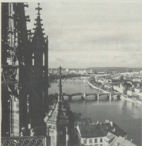
Bâle, coup d'œil de la cathédrale sur le quartier industriel. Les deux ponts relient la ville au Petit-Bâle. Carrefour reliant la Suisse à la France et à l'Allemagne.