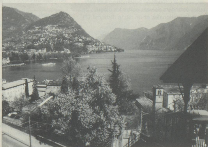
Lugano, ville la plus importante de la Suisse méridionale, est située dans une baie protégée des vents par le Monte Bré et le San Salvatore. Les activités de congrès et de commerce se marient fort bien avec le délassement et le calme dans la vieille ville. C'est la frontière reliant la Suisse à l'Italie.