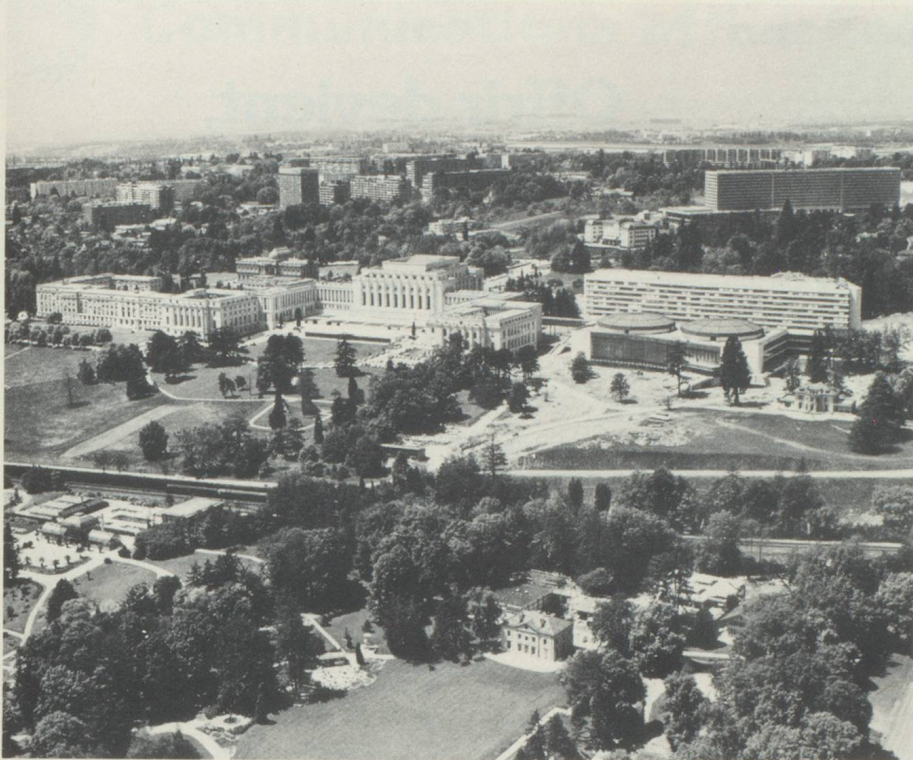
Les office de l'ONU à Genève

long terme accomplir un travail efficace. Il est devenu nécessaire de prendre part de manière continue aux travaux des Nations Unies afin de pouvoir suivre les problèmes du début à la fin. Nous devons aussi être à même de réaffirmer nos vues et de faire progresser les conceptions auxquelles nous sommes attachés. C'est ainsi que notre absence volontaire de l'ONU nous fait courir le risque d'un isolement qui ne peut que desservir nos intérêts. La raison nous commande donc de prendre une part entière à la coopération politique, économique et sociale qui se déroule au sein de l'ONU. Nous pouvons ainsi mettre fin aux inconvénients qui résultent pour nous, aujourd'hui, du fait que notre participation y reste limitée dans divers domaines. Nous serons en mesure de mieux défendre nos intérêts et de présenter nous-mêmes directement notre politique à la communauté des Etats. Ceci est d'autant plus important que nous avons toujours considéré qu'une participation ac-