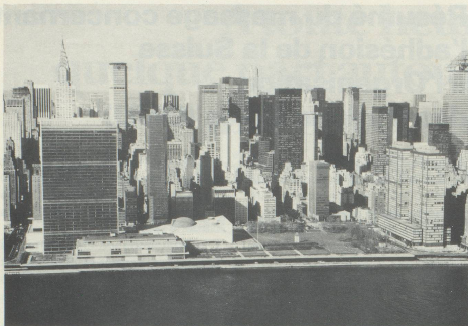
L'ONU à New York

transformé la nature des conflits et ceci a conduit l'ONU à concevoir de nouvelles méthodes de maintien de la paix , telles que l'envoi de missions de médiation ou d'observation et de contingents de Casques bleus. L'ONU a créé ainsi, sur une base volontaire, un instrument capable de créer les conditions préalables à un règlement pacifique ou de contribuer à la recherche d'un tel règlement.