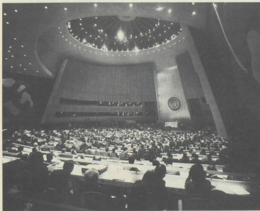
L'Assemblée plénière de l'ONU

tions établies par la Charte, ainsi que sur la politique de la Suisse à l'ONU. Selon le chapitre VII de la Charte, il incombe au Conseil de sécurité, en cas de menace contre la paix, de rupture de la paix ou d'acte d'agression, de prendre des mesures collectives contraignantes, de nature militaire ou non militaire. Une telle décision requiert l'accord des cinq membres permanents du Conseil de sécurité – Chine, France, Grande-Bretagne, Union soviétique et Etats-Unis – qui disposent chacun du droit de veto. La participation de la Suisse aux mesures militaires prévues à l'article 42 de la Charte ne saurait entrer en considération, parce qu'elle serait contraire au droit de la neutralité. Conformément à l'article 43, aucun Etat ne peut toutefois être contraint, de manière automatique, à participer à des sanctions militaires; au contraire, le Conseil de sécurité doit, dans tous les cas, conclure avec l'Etat en question un accord particulier sujet à ratification. De plus, le conseil de sécurité a le pouvoir, selon l'article 48,