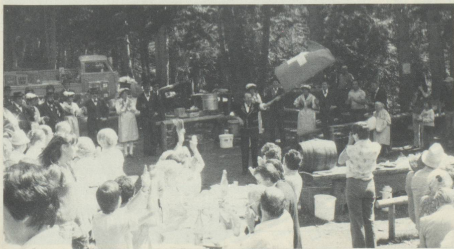
Un groupe folklorique agrémente l'excursion du dimanche.

L'après-midi fut consacré à divers problèmes et avant tout au message du Conseiller fédéral Aubert qui rendit son auditoire attentif au travail de son Département, actuellement préoccupé par les relations de la Suisse avec l'ONU. Il défendit la thèse de l'interdépendance internationale toujours croissante, à laquelle la Suisse ne peut se soustraire, son adhésion à l'ONU s'avère nécessaire dans le cadre de la politique extérieure traditionnelle et pragmatique. Au début, les relations extérieures de