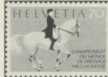
70 c. Championnat du monde de dressage, Lausanne