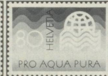
80 c. Association internationale des distributions d'eau.

DIRECTRICE DE LA PUBLICATION : Nelly SILVAGNI-SCHENK