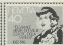
40 c. Schweiz Centenaire de l'Armée du Salut en Suisse

Championnat du monde de dressage, Lausanne Hermann Schelbert, Olten