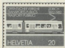
20 c. Centenaire du tramway à Zurich