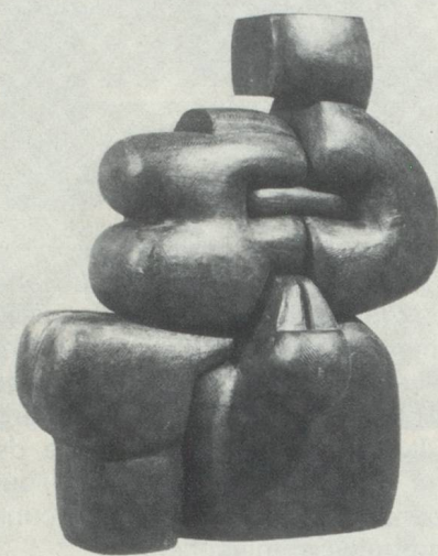
« L'espace l'a sculpté » 1980 bois teinté hauteur 60 cm.