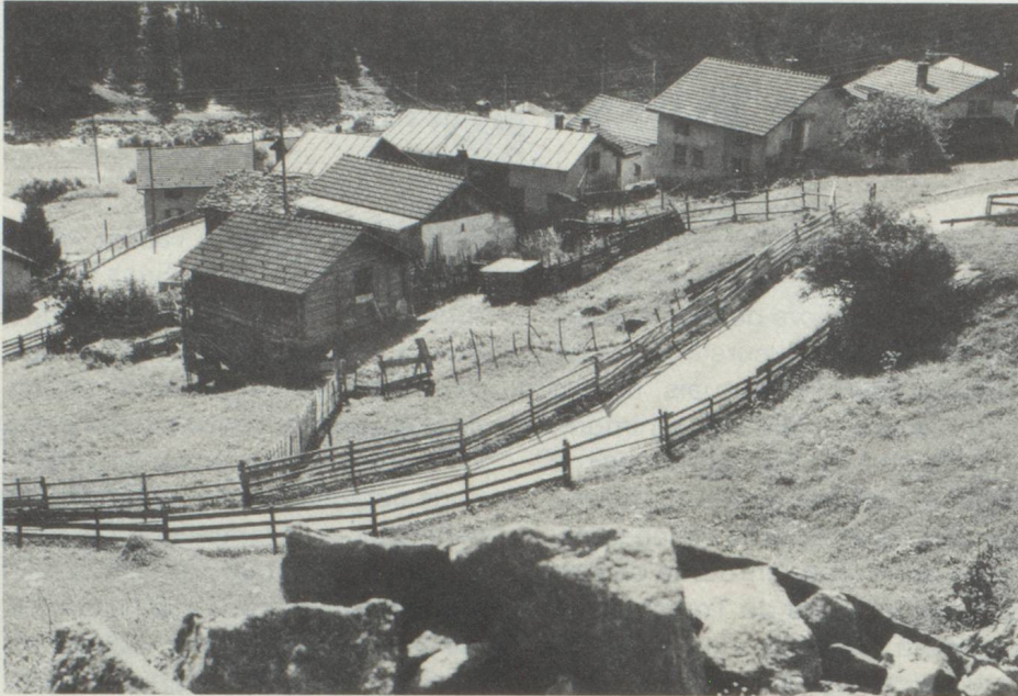
Vue du village d'Ausserferrera dans le val d'Avers, Grisons.

escaladant les Alpes en direction du Sud jusqu'au Tessin, au val d'Ossola et de chaque côté du Mont Rose, dans les vallées transversales du nord de la vallée d'Aoste. De petits groupes épars s'avancèrent finalement jusqu'en Savoie, comme l'indique, par exemple, le nom bien significatif de ce petit coin au Nord de Chamonix, «Les Allamands». Des colonies de Walser s'étendirent ainsi dans les Alpes sur une longueur de plus de trois cents kilomètres d'Ouest en Est. Une autre colonie walser sur sol français se trouvait à Vallorcine, dans la partie la plus haute de la vallée du Trient.