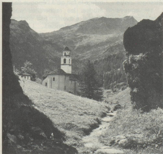
L'église de Bosco-Gurin