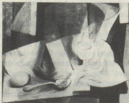
Nature morte au coquetier Huile 38 x 46 Théodore Strawinsky

Un regard rapide découvre d'abord le sujet, aisément lisible, sur lequel vient jouer la lumière, puis la subtilité de l'accord des couleurs, mais un peu plus d'attention révèle le rebondissement de la ligne fragmentée qui trouve toujours en contre-poids son contraire, les équivalences des surfaces, et cette analyse de l'objet par l'intérieur qui fait songer à Braque ou La Fresnaye.