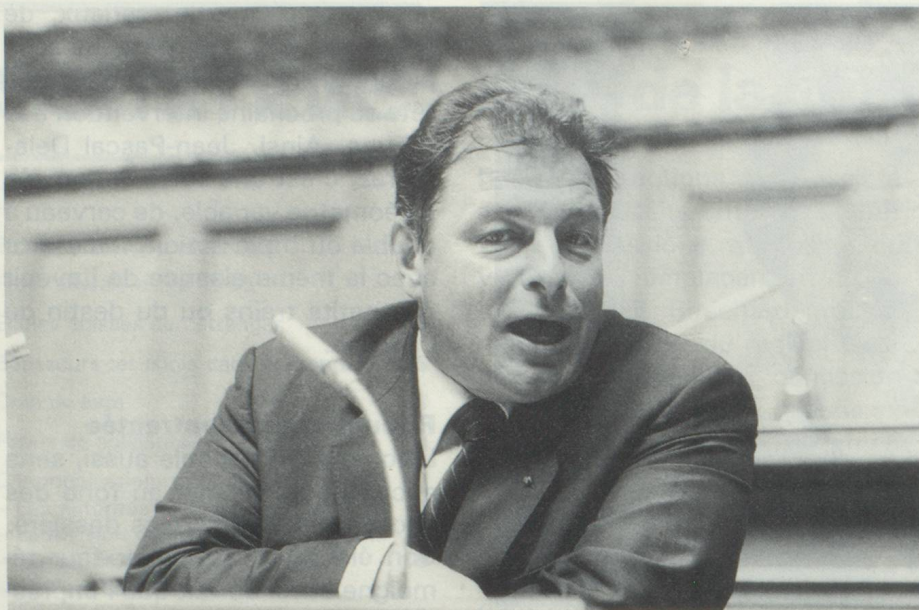
M. Jean-Pascal Delamuraz, Conseiller fédéral

vocabulaire, aime utiliser le terme «synergie» et tabler sur l'effet d'entraînement qu'il signifie. On peut se demander parfois s'il n'est pas entraîné lui-même par son propre mouvement, jusqu'à risquer de trébucher. D'où le reproche entendu de se disperser. L'homme d'Etat doit certes rester généraliste, mais il ne saurait être touche-à-tout.