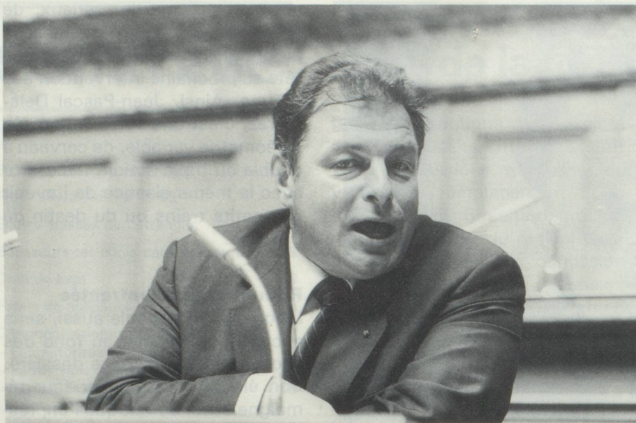
M. Jean-Pascal Delamuraz, Conseiller fédéral

vocabulaire, aime utiliser le terme «synergie» et tabler sur l'effet d'entraînement qu'il signifie. On peut se demander parfois s'il n'est pas entraîné lui-même par son propre mouvement, jusqu'à risquer de trébucher. D'où le reproche entendu de se disperser. L'homme d'Etat doit certes rester généraliste, mais il ne saurait être touche-à-tout.