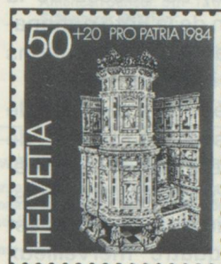
50 + 20 c. Freulerpalast, Näfels Palais Freuler, Näfels Palazzo (Freuler), Näfels