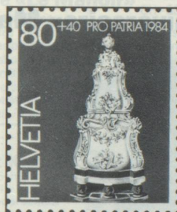
80 + 40 c. Museum Ariana, Genf Musée Ariana, Genève Museo Ariana, Ginevra