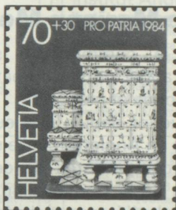
70 + 30 c. Musée grüerien, Bulle