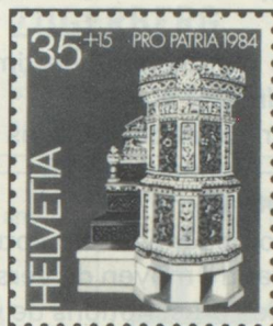
35 + 15 c. Landesmuseum, Zürich Musée nationale suisse, Zurich Museo nazionale svizzero, Zurigo

Cette année, le produit du Don de la Fête nationale est en faveur des oeuvres des Suisses de l'étranger. La première collecte ayant eu ce même but date de 1924, d'autres suivirent tous les six ou sept ans. Les bénéficiaires en seront donc l'Organisation des Suisses de