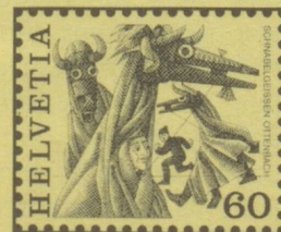
Schnabelgeissen, Ottenbach ZH