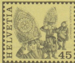
Klausjagen, Küsnacht a. R. SZ