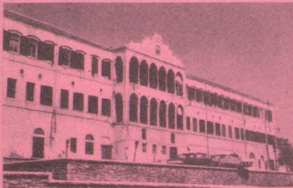
Ambassade rue John Kennedy Immeuble Achou B.P. 172 Tél. : 366.390/1 BEYROUTH du lundi au vendredi