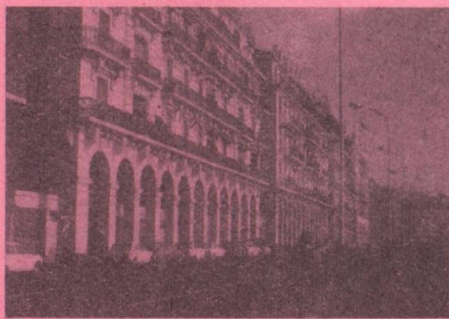
Ambassade 27, bd Zirout Youcef B.P. 482 Tél. : 63.39.02, 63.83.12, 64.65.91 ALGER GARE de 9 h à 12 h du dimanche au jeudi