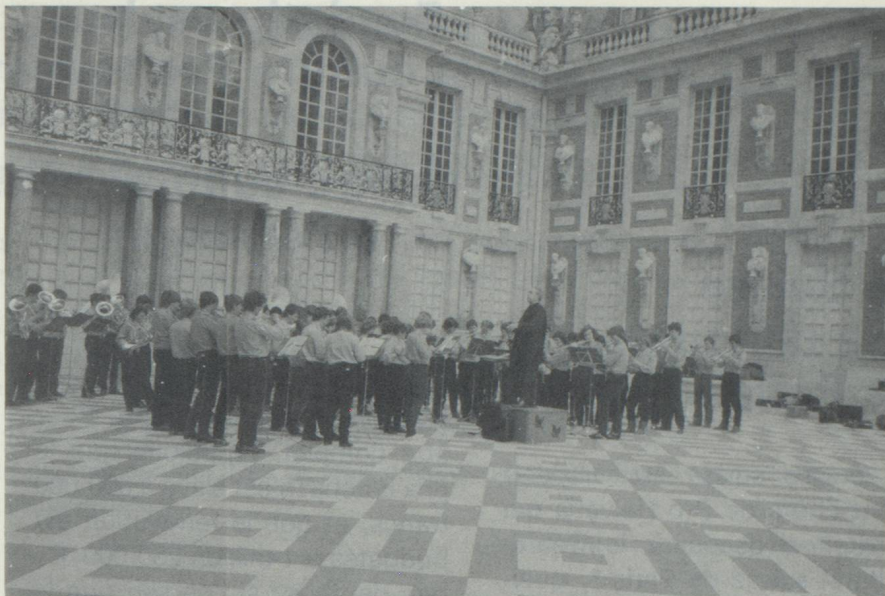
A Versailles, les étudiants d'Einsiedlen