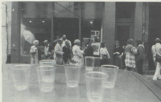
Au 17 de la rue St Sulpice

Sous sa présidence, la section participera à l'exposition d'Aarau 1972, organisera les expositions itinérantes en Savoie, Thonon, Chambéry, Annecy,