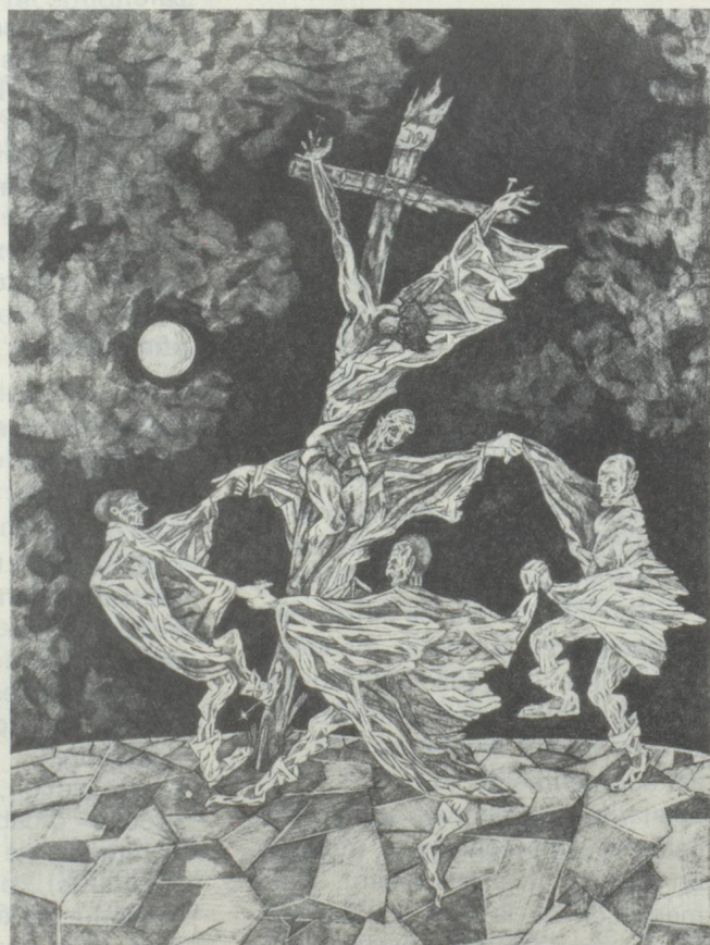
Crucifixion I 1939 - plume - 48 x 36 cm

« Dessiner d'après modèle me paraissait indigne. Pas question de copier la nature, d'apprendre à observer. J'estimais qu'un peintre devait tout maîtriser par son seul pouvoir de représentation. Ce que je dessinais ne pouvait prétendre à la moindre crédibilité anatomique ou biologique. Mais cela signifiait quelque chose ; c'était bien suffisant. Aujourd'hui encore, je dessine et je peins avec la même absence de scrupules. Lorsque je présentai à Varlin l'une de mes rares huiles, « La Catastrophe » (qui date de 1968), le grand peintre considéra la toile avec stupeur, et ne voulut pas vraiment croire ce qu'il voyait : sur un pont, au-dessus d'une gorge, deux trains bourrés de passagers se heurtent en pleine course ; tous deux jaillissent d'un tunnel, cherchant furieusement l'air libre, et trouvant leur perte ; ils se fracassent contre un autre pont, beaucoup plus bas, sur lequel défile une manifestation communiste ; si bien que les ponts, les trains, les passagers et les communistes s'écroulent sur une église de pèlerinage, tout au fond de la gorge, et dont les décombres ensevelissent d'innombrables pèlerins, tandis qu'en haut, bien au-dessus du gouffre, dans le bleu d'un ciel de printemps, le soleil se fracasse contre un autre soleil, inaugurant la destruction de la terre et de tout le système planétaire. Varlin se taisait. Finalement, d'une voix soucieuse, il formula cette opinion : « Un adulte ne devrait pas peindre des choses pareilles. »