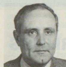
Pro: Flavio Cotti, Conseiller national, PDC, avocat et notaire, Locarno.

En d'autres termes, une fois membre de l'ONU, la Suisse se verrait placée devant les mêmes problèmes ou devant des choix fort semblables, par rapport à sa politique de neutralité, que ceux auxquels elle est confrontée aujourd'hui en tant que non-membre. Cette remarque est également valable en ce qui concerne les votes dans les principaux organismes de l'ONU. Aujourd'hui déjà, dans ses organisations spécialisées (par exemple à l'Unesco), dans la Conférence sur la sécurité et la coopération en Europe (CSCE) ou lors de sanctions de la Communauté économique européenne (CEE), elle décide en toute souveraineté d'une voie compatible avec sa politique de