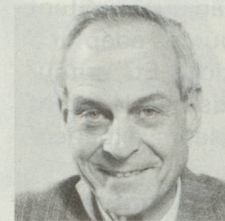
Pro: Rudolf Friedrich, ancien Conseiller fédéral, PRD, avocat, docteur en droit, Winterthour.

Nations Unies, c'est qu'ils ne font que tirer les conséquences des attitudes adoptées jusqu'ici et des expériences faites. Ces attitudes sont déjà pleinement celles d'une participation, mais sans les droits qu'implique la qualité de membre à part entière. Quant aux expériences, elles ont prouvé que continuer de se tenir à l'écart des