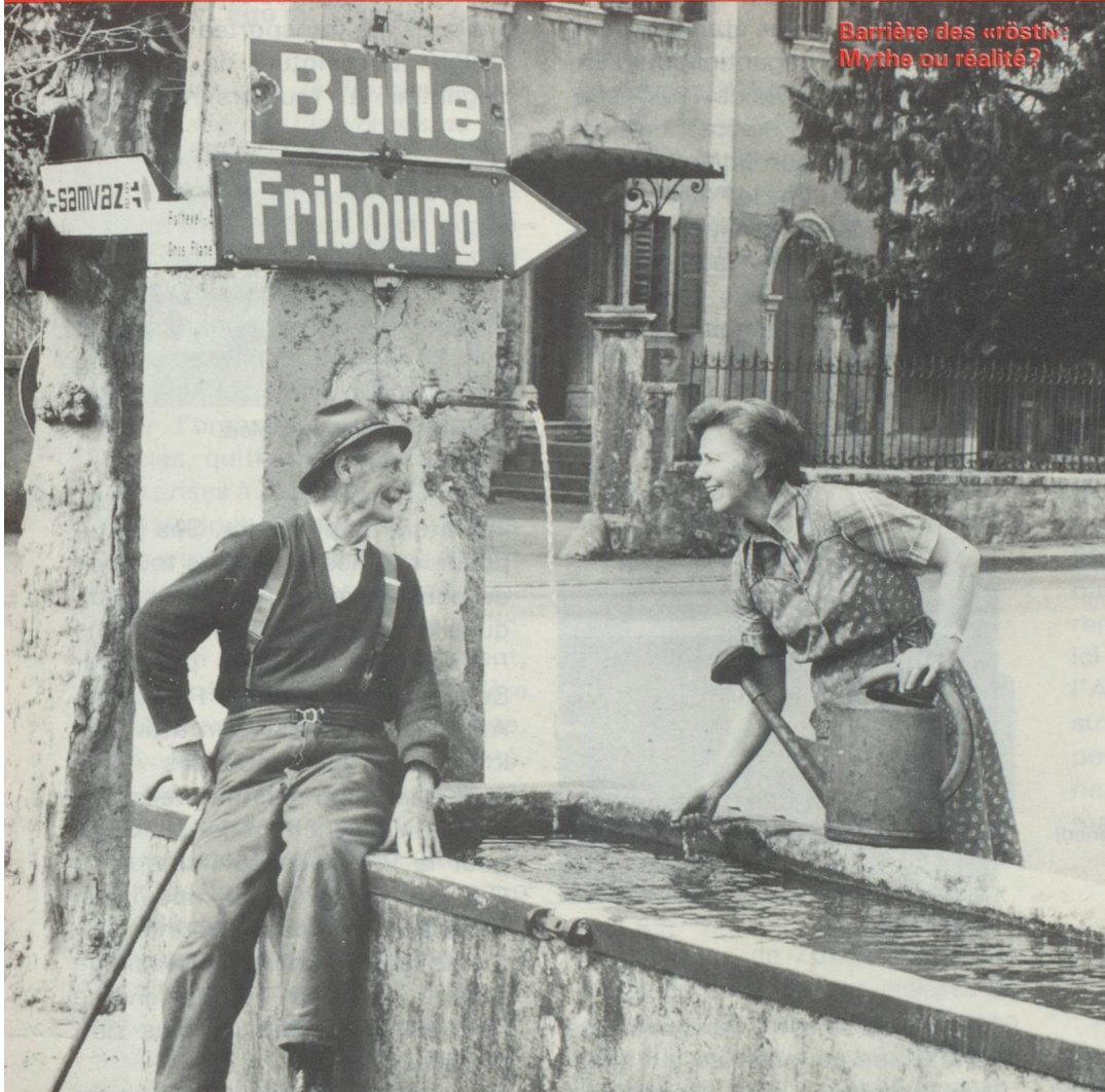
Barrière des «röstis» Mythe ou réalité?