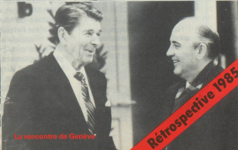
La rencontre de Genève