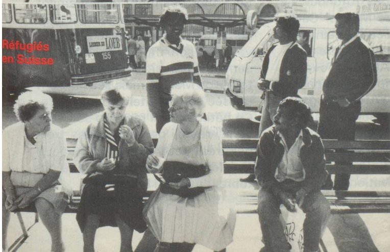
Réfugiés en Suisse