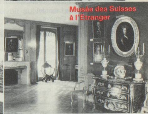
Musée des Suisses à l'Étranger