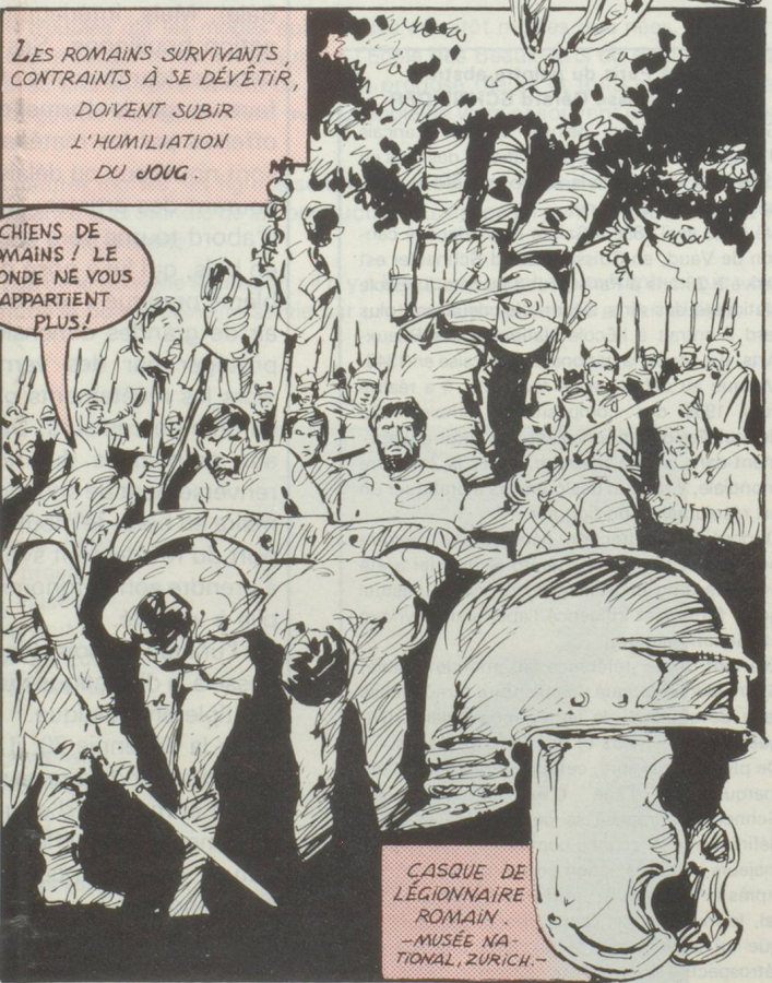
CASQUE DE LÉGIONNAIRE ROMAIN - MUSÉE NATIONAL, ZÜRICH.

CHIENS DE ROMAINS ! LE MONDE NE VOUS APPARTIEN PLUS !