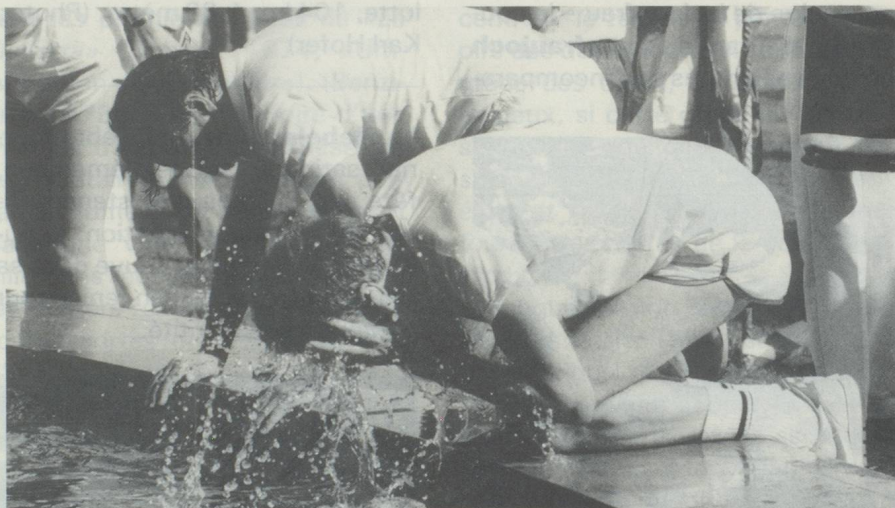
Après l'effort, les rafraîchissements

De bons soins font la moitié de la victoire