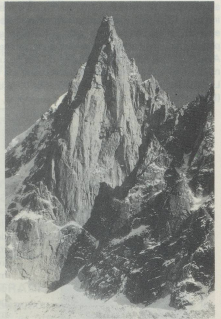
Le Mettelhorn au dessus de Zermatt et un site idéal pour photographier la silhouette traditionnelle du Cervin

Panorama des Alpes vient de paraître aux Editions 24 heures . Un livre de 168 pages, au grand format 34 x 30 cm, illustré de 110 photographies, toutes en couleurs et la plupart en format panoramique de 2 à 4 pages (soit jusqu'à 128 cm de long), 30 cartes géographiques en 4 couleurs, graphiques avec indication des sommets illustrés. Livre relié, sous étui. Edition normale : prix Fr. 149.-S. Edition de luxe : prix Fr. 179.-S. En vente aux Editions 24 heures, avenue de la Gare 33, 1001 Lausanne, tél. 021/49.45.49.