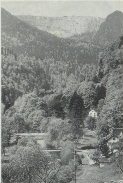
Les Gorges de l'Areuse

Un livre qui plaira aux Neuchâtelois et ils sont nombreux en France