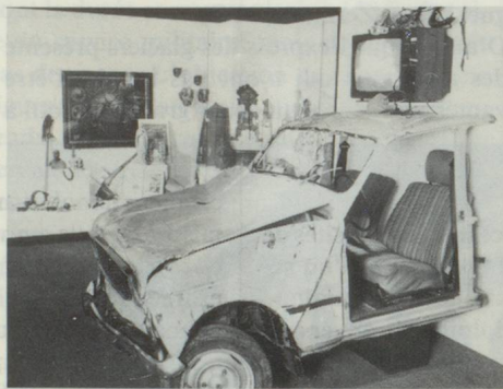
L'exposition «Le mal et la douleur» au musée d'ethnographie de Neuchâtel.

Les visiteurs qui se passionnent pour les animaux trouvent leur bonheur à Estavayer-le-Lac où un ancien capitaine de la Garde suisse du Vatican, François Perrier, a consacré