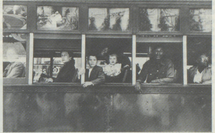
Robert Frank, La Nouvelle-Orléans, 1955-1956