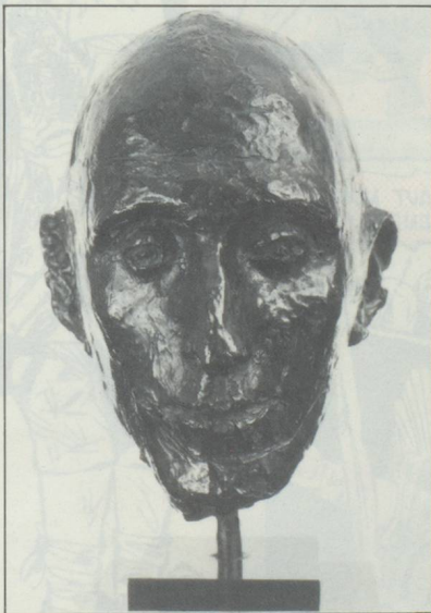
Buste de l'écrivain par Germaine Richier en 1943. Propriété du musée de la Majorie (Valais).

N'ignorant rien des peines du paysan, Borgeaud se souvient trop bien du petit garçon de dix ans qui gerbait le blé, ramassait betteraves ou pommes de terre dans une ferme vaudoise, pour avoir cherché dans la rude et belle nature de son coin du Lot, des illusions d'écologistes rêvant de l'eau du puits et de légumes poussant par miracle.