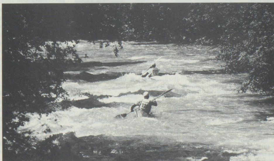
* Descente nationale en eau vive, Saanen, (Oberland Bernois), 27/28 juin 1987.