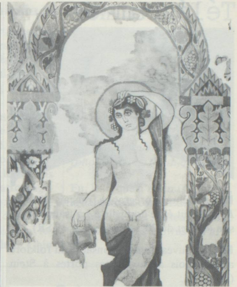
Le dieu de la vigne, personnage central de la tapisserie de Dionysos.

La salle où ce chef-d'œuvre est exposé – en