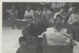
Le cirque d'enfants Basilisk (photo: J.-Ph. Daulte).

D'innombrables spectacles, expositions, conférences et films feront de Lausanne la capitale du cirque jusqu'à la mi-octobre. Quelque 400 artistes s'y sont donnés rendez-vous cet été. Parmi eux, le clown et jongleur Carello, les maîtres de l'illusion Fantasio et Mr. Steve, le clown Marco Morelli, le contorsionniste Rocky Rendal, les chiens acrobates et le «Theatro Ingenuo», Crouton, le spectacle de rue de Karl Kuene, le dompteur de panthères Hans Bleiker, les magiciens chinois Chun Chin