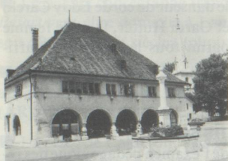
Hôtel des six communes, Môtiers (photo: J.-P. Mäder).

Le produit de la collecte 1987 en faveur de la protection du patrimoine servira à restaurer une trentaine de maisons à Môtiers, dans le Val-de-Travers. Le philosophe Jean-Jacques Rousseau a vécu plus de trois ans (1762-1765) dans ce petit village du Jura neuchâtelois, qui aujourd'hui encore semble sorti d'un livre d'images.