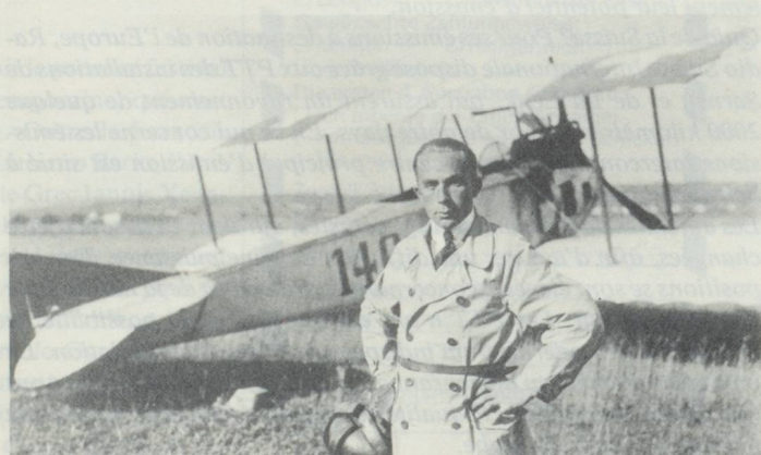
Walter Mittelholzer, pilote militaire...

Werner Mittelholzer naquit le 2 avril 1894, à St-Gall. Fils d'un maître-boulangier, il se passionna dès son plus jeune âge pour la montagne et la photographie.