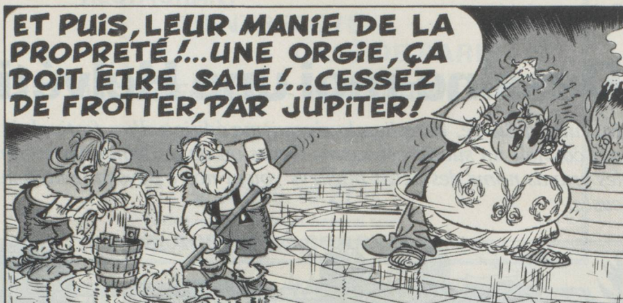
Les Romains ont des problèmes avec la fondue au fromage et la propreté suisse (dans «Astérix chez les Helvètes»).

jeunesse. Publié l'an dernier par le magazine l'illustré, «Les Helvétiques» a paru interminable même aux fans les plus enthousiastes du grand dessinateur vénitien, aujourd'hui établi à Grandvaux (VD).