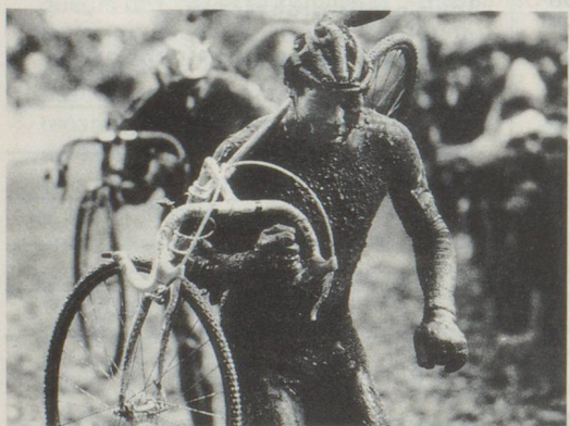
Pascal Richard, le roi suisse de la piste boueuse.