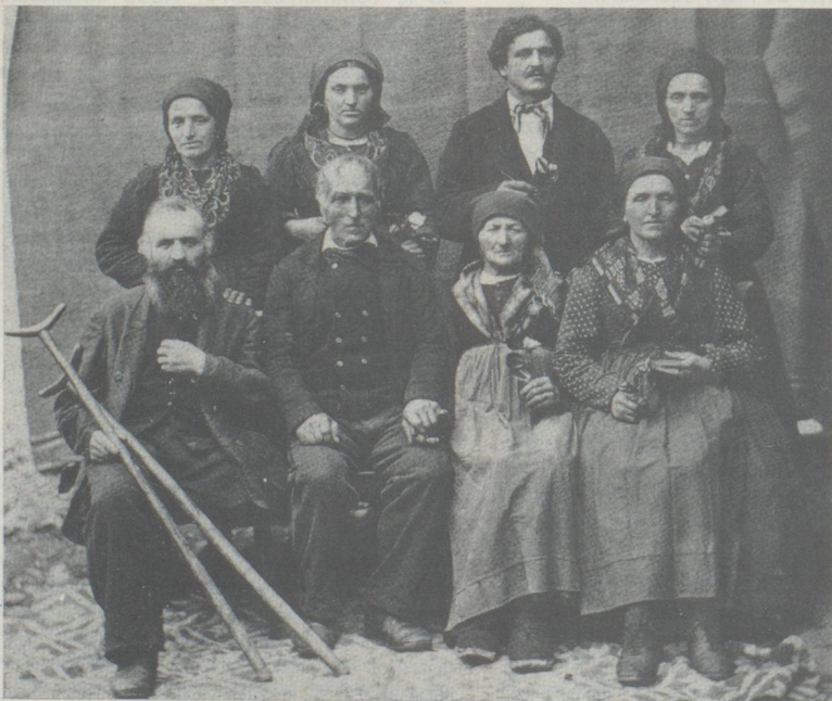
Portrait de groupe pris entre 1870 et 1900.

Ces photographes ambulants, parfois colporteurs de métiers, ne limiteront pas leur travail au seul portrait. Nombre d'entre eux semblent avoir fixé sur la plaque sensible des traits quotidiens de ces populations, de ces