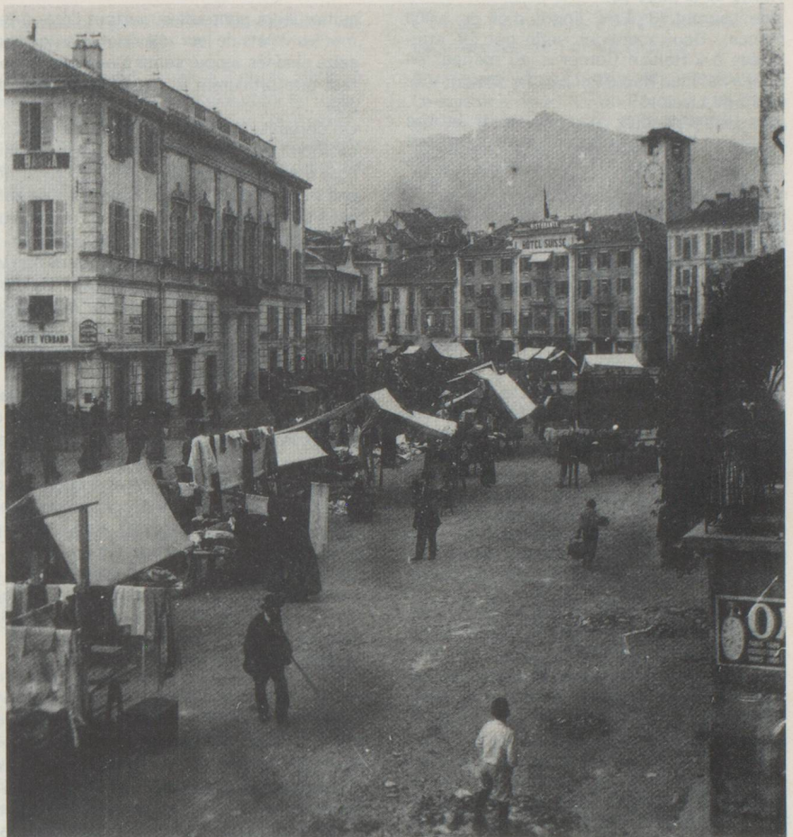
Scène de marché sur la Piazza Grande à Locarno vers 1902.