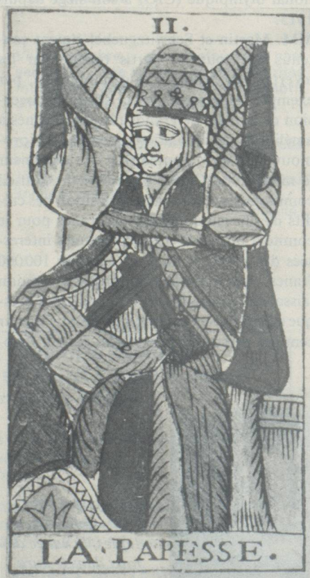
Carte d'un jeu de tarots datant de 1760 environ, représentant la papesse.

Les jeux de cartes du moyen âge ont un point commun avec ceux qui les ont remplacés aujourd'hui: ils sont divisés en quatre couleurs. Comme on le sait, nos jeux de yass ont conservé jusqu'à ce jour cette répartition. Les cartes allemandes ont leurs propres noms («Schilten, Schellen, Rosen, Eicheln»). Pour les cartes françaises, on parle de pique, carreau, cœur et trèfle. Ces quatre couleurs sont peut-être une survivance de la prédilection qu'avaient les anciens pour une