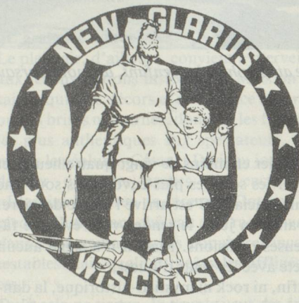
...faisant le tour du monde (colonie suisse de New Glarus aux Etats-Unis)...

L'usage qu'on en fait en politique est un peu déplaisant. En effet, il a lutté aussi bien pour que contre l'adhésion de la Suisse à l'ONU, a voté pour des communistes, ce qui ne l'a pas empêché de soutenir une fois ou