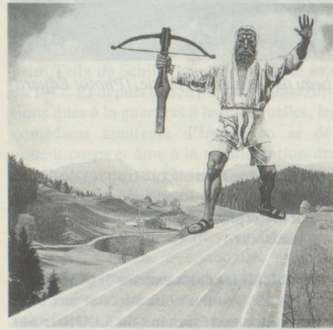
Guillaume Tell menant un combat politique («Halte au béton»)...

Comme on le sait depuis longtemps, le phénomène de notre héros national ne peut faire l'objet d'une approche purement scientifique et historique. Au lieu de nous demander si Tell est un personnage historique, nous ferions mieux de considérer l'histoire de son influence à travers les siècles ainsi que son aspect symbolique, psychologique, sociologique et mythique. Un ouvrage récem-