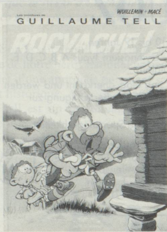
René Wullemin, Gilbert Macé. Les aventures de Guillaume Tell (aujourd'hui, 5 volumes sont parus). Editions des 3 Pommes. Case postale 127, 1211 Genève 4.

complet. Guillaume est un Helvète moyen, avec ses coups de cœur, ses rognés, ses soucis, ses agacements, ses colères, ses contrariétés, ses coups de gueules, ses scènes de ménage, ses impôts, ses amis et ses ennemis.