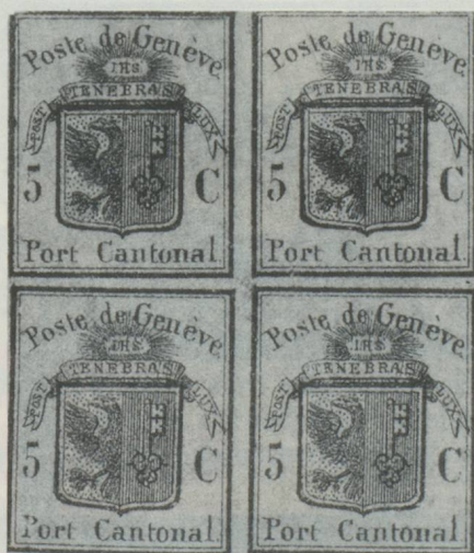
GENÈVE — « Port Cantonal » Émis en 1845 - Bloc de 4