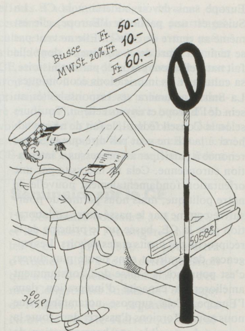
Bientôt la TVA en Suisse?

Aujourd'hui déjà, les rédacteurs législatifs s'efforcent dans toute la mesure du possible d'élaborer des textes qui soient conformes