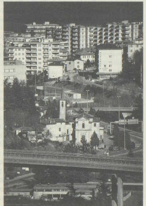
L'urbanisation du Tessin: le 76 pour cent de la population vit dans des agglomérations (Lugano).

L'image traditionnelle, qui évoque la petite dimension d'un canton montagnard, séparé par les Alpes et possédant une frontière au sud, justifia «le développement raté et précaire du Tessin, parce que bloqué par des in-