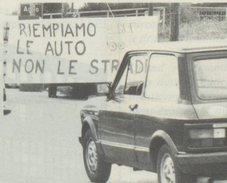
Protestation contre les pendulaires venant en voiture, dans le Malcantone: «Remplissons les voitures et non les routes.»

Ces chiffres montrent la profonde évolution de l'organisation territoriale cantonale. Le Tessin, une des régions les plus montagneuses de Suisse, est aujourd'hui parmi les plus urbanisées – le 76% de la population réside dans les quatre agglomérations de Lugano,