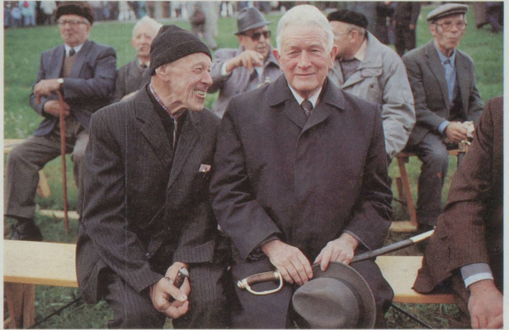
Pour la dernière fois entre eux: les hommes des Rhodes-Extérieures à la landsgemeinde (avec l'épée servant de carte d'électeur).

La question du droit de vote des femmes dans le canton d'Appenzell n'est pas l'un des chapitres les plus glorieux de notre démocratie. Le demi-canton d'Appenzell Rhodes-Extérieures vient de décider d'accorder le droit de vote aux femmes. Il est l'avant-dernier (demi-)canton et, à notre connaissance, l'avant-dernier Etat du monde à le faire. Après quatre votes négatifs, la landsgemeinde (composée d'hommes) du 30 avril 1989 à Hundwil s'est enfin prononcée en fa-