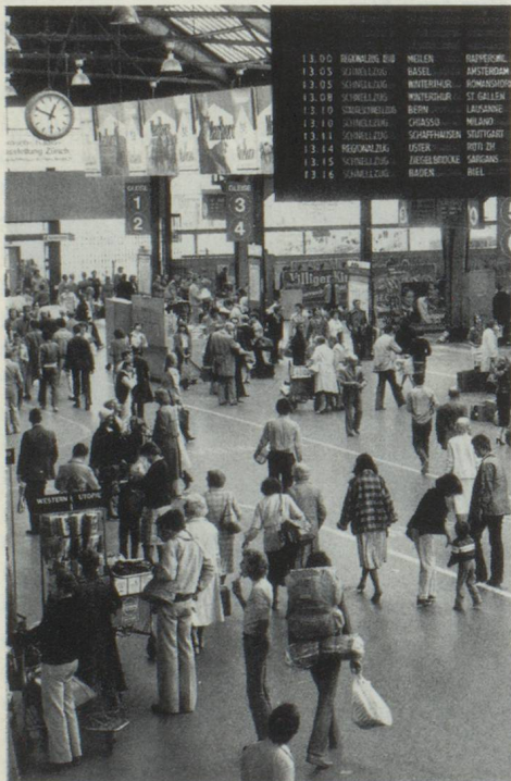
L'exactitude des trains suisses: un phénomène étonnant pour beaucoup d'étrangers.

A ce sujet, il semble que l'argent est aussi abondant en Suisse que le sable au bord de la mer. Personne ne sait exactement combien il y en a. Il est vrai que les Suisses ont de l'argent, mais ils ne le montrent pas. La majorité des gens croit naïvement – et je dirai qu'en cela aussi, la clairvoyance n'est pas supérieure à la moyenne – que la stabilité et la prospérité que connaît actuellement la Suisse sont le fruit du travail acharné de la population. Cette majorité ne pense pas un seul instant à l'afflux en Suisse de milliards de