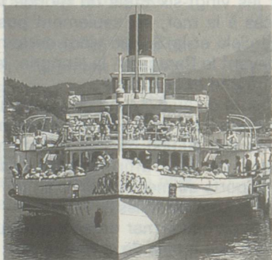
La plus grande flotte européenne de bateaux à vapeur navigue sur le lac des Quatre-Cantons.