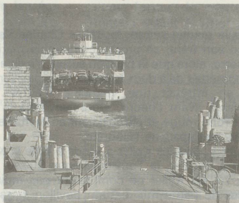
Le Ferry Beckenried-Gersau (lac des Quatre-Cantons).