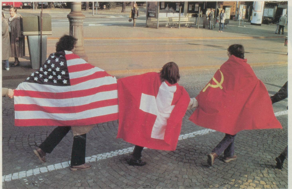
Est et Ouest se tendent la main.

Ils vont de l'école des enfants jusqu'aux attractions dans une discothèque – interdites par la suite – en passant par «l'école des hommes» (le service militaire). Les contrastes se succèdent: après la mort, un tabou, c'est le bal des officiers, puis l'on voit des baraques où sont logés des demandeurs d'asile et immédiatement après des enfants en train de jouer et des enfants malades. Sous le titre ambigu «Le climat de la Suisse», on trouve côte à côte des photos montrant un ordinateur dans une étable et un défilé de mode, un feu de 1 er août et la Foire aux oignons de Berne ainsi qu'une photo particulièrement réussie avec une voiture à