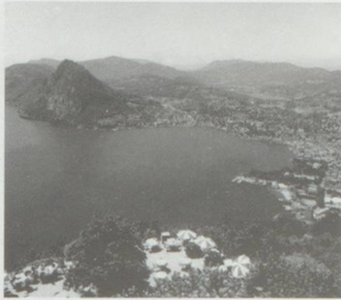
Ci-dessus : Lugano et son sommet bien connu, le San Salvatore.