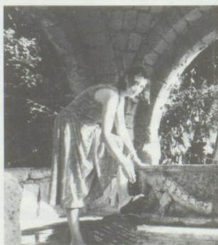
Suisse à 42°C. Il fait bon se rafraîchir les pieds à une fontaine séculaire.