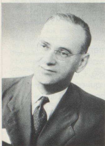
Carl Lutz.

En 1944, Carl Lutz, qui était alors vice-consul de Suisse et chef de la division de la protection à Budapest, a réussi à sauver la vie de plusieurs milliers de Juifs hongrois grâce à une méthode géniale. Un monument de bronze sera inauguré en son honneur au mois de décembre prochain au centre de la capitale hongroise.