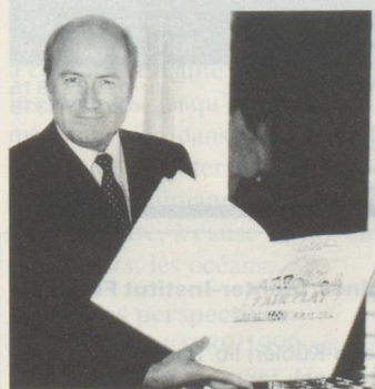
Joseph Blatter.

Depuis lors, les protestations contre le nouvel évêque – mal aimé – de Coire n'ont plus cessé et ont atteint leur paroxysme – du moins pour le moment – lorsque Mgr Haas a décidé de ne pas confirmer dans ses fonctions Gebhard Matt, vicaire général pour le canton de Zurich. WIL