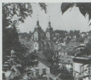
Le scandale des fiches se poursuit à St-Gall.

Le gouvernement saint-gallois entend exiger que la Confé-