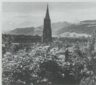
A Bern, la base pour une nouvelle constitution a été acceptée.

Les Bernois ont accepté, lors des votations du 23 septembre dernier, l'introduction d'un nouveau système de votations pour la révision totale de la constitution. Cette modification devra permettre de soumettre différentes variantes au souverain sur des points précis, lors du vote pour la nouvelle constitution (celle-ci devrait être soumise au peuple en 1992 et 1993).