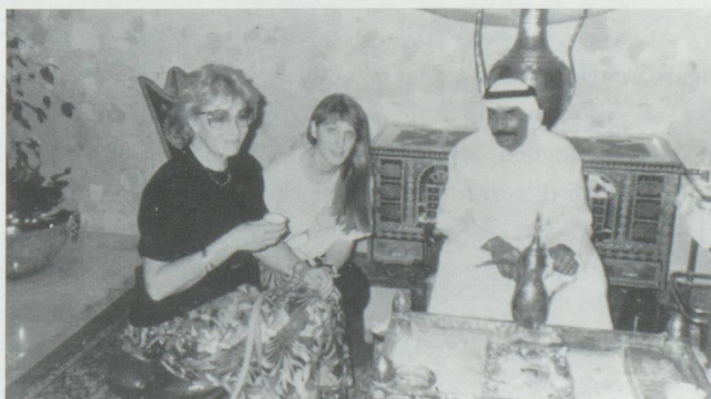
Le Cafetier et les Suissesses dégustant la "Gahwa", le café, bouilli à petit feu sur des cendres et du charbon.