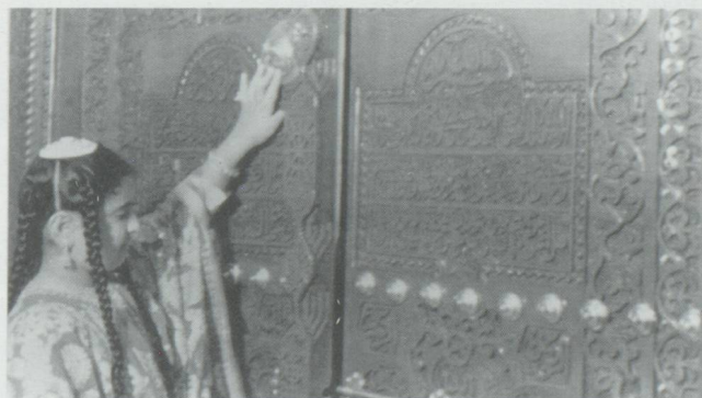
L'Architecture dans la gravure sur bois.