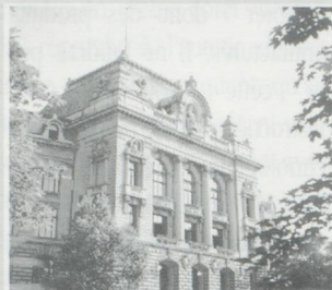
L'Université de Berne. Des cours seront suspendus pour des raisons économiques.

Les cours de sociologie du développement, donnés par le Conseiller National socialiste Jean Ziegler, chargé de cours depuis 1968 à l'Université de Berne, sont menacés par les économies imposées à la haute école. La Faculté de Droit et de Sciences Economiques a en effet décidé de suspendre en premier lieu les postes des chargés de cours.