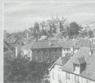
A Neuchâtel, on se demande qui est pauvre dans le canton ...