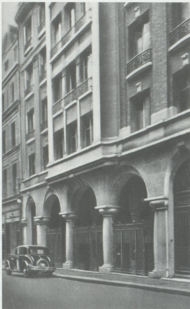
L'immeuble de la rue des Messageries au temps où le station- nement ne posait pas problème.

un jeu de quilles. Cette maison suisse est toujours là, 10, rue des Messageries, mais les temps ont changé.