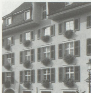
Acheter un appartement ou une maison avec l'argent du 2ème pilier.

Les personnes désirant acheter une maison ou un appartement doivent pouvoir retirer en espèces l'argent de leur deuxième pilier. Le Conseil Fédéral doit adresser courant mai un message en ce sens au Parlement afin que celui-ci puisse se décider avant la fin de l'année, au moment où sera revue la loi sur le libre passage. Cette décision fait suite aux résultats de la procédure de consultation concernant l'encouragement à la propriété du logement au moyen de la prévoyance professionnelle. Personne ne contestait l'utilisation des fonds du deuxième pilier pour l'accession à la propriété, mais les avis divergeaient sur les moyens d'y parvenir. Chacun s'accorde cependant pour relever que la réglementation actuelle en matière de mise en gage est insuffisante. Les prises de position demandent que, non seulement les prestations obligatoires de vieillesse, mais encore toutes les prestations de prévoyance professionnelle, ainsi que le capital de prévoyance lui-même, puissent être mis en gage. Concernant l'utilisation directe des fonds de prévoyance, les prises de position donnaient la préférence au retrait en espèces plutôt qu'au prêt, car la première est plus transparente et plus facilement applicable dans la pratique. Le Conseil Fédéral a suivi cette proposition, dont les inconvénients - principalement au niveau des impôts, sont compensés par de nombreux avantages. ■