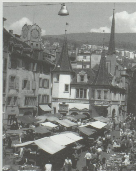
Un prix pour faire connaître Neuchâtel.

La Fondation pour le rayonnement de Neuchâtel vient d'annoncer la création d'un prix destiné à récompenser une