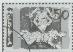
50 cts. : clowns au trapèze.