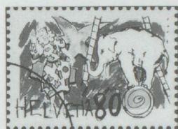
80 cts. : clowns blancs avec éléphant.