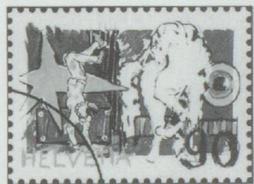
90 cts. : Arlequin avec lippizan.