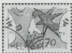
70 cts. : Auguste avec otarie.