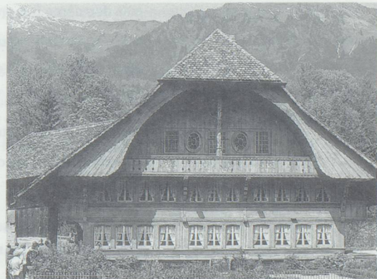
PHOTO DU HAUT : MUSÉE DE BALLEMBERG PHOTO DU BAS : LOCOMOTIVE SUR LA LIGNE DU BRÜNIG.

Ayez donc de la Suisse dans les idées: la région du Brünig et son petit train vous attendent. ■