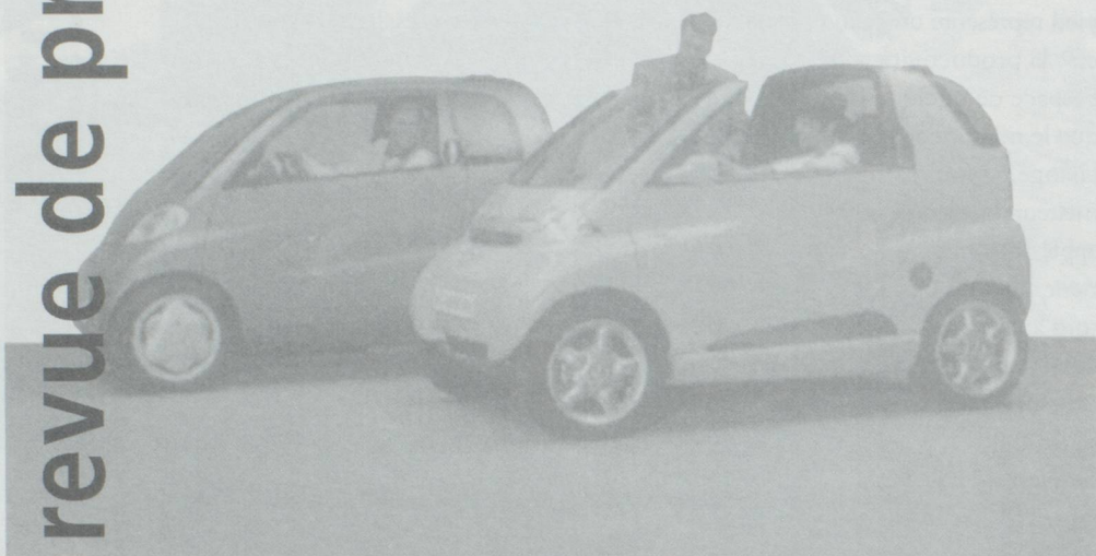
Encore bien floue : la fameuse Swatchmobile.

Difficile de savoir où en est le projet de la Swatchmobile, cher à Nicolas Hayek, et dont le lancement est prévu pour 1997. A peine peut-on savoir combien de personnes travaillent sur le projet. A Bienne, siège de la société commune SMH-Mercedes chargée de créer la future voiture, on indique qu'une centaine de personnes, dont plus de la moitié en Suisse, y travaillent. On ignore tout de la répartition des tâches entre les ateliers allemands et ceux de Bienne. Mais un organigramme du service de communication de Mercedes fournit cette indication qu'en Allemagne, les points forts sont la technologie et le design. Les services des finances, du marketing et de la distribution sont centralisés en Suisse. A en croire la presse spécialisée, les premiers véhicules devraient être dotés d'un moteur à essence, alors que Nicolas Hayek a toujours souhaité privilégier un système de propulsion écologique. Mais pour les spécialistes, la conception d'une voiture dotée d'un moteur fonctionnant à l'électricité et à l'essence pose le problème du développement d'un système de gestion électronique complexe. La collaboration avec Mercedes (annoncée en février 1994) a provoqué pas mal de bouleversements à Bienne. Les changements se sont